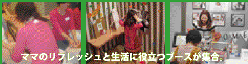
ママのリフレッシュと生活に役立つブースが集合。