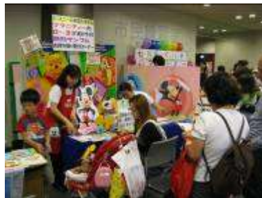
ワールド・ファミリー