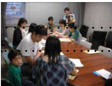
緊急サポート・ちばっ子ネット説明・登録会