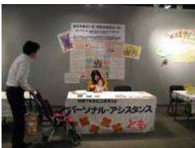
社会福祉法人パーソナル・アシスタントとも