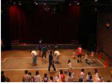
バルドルール浦安の親子フットサル教室