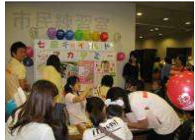
七田式チャイルドアカデミー