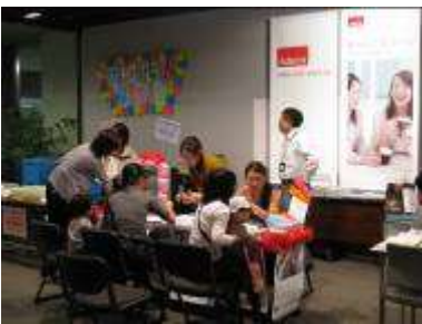
千葉中央ヤクルト販売(株) 造り方