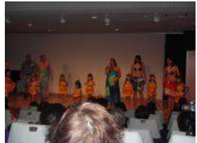
親子で一緒にレッツダンス