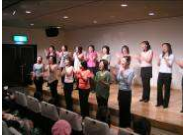
一緒にうたおう！歌の贈り物