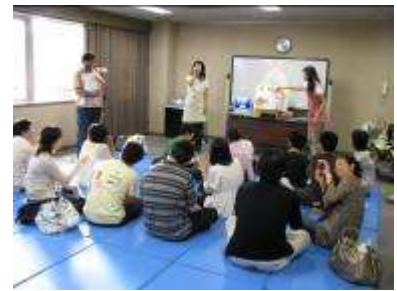
ベビーサイン体験