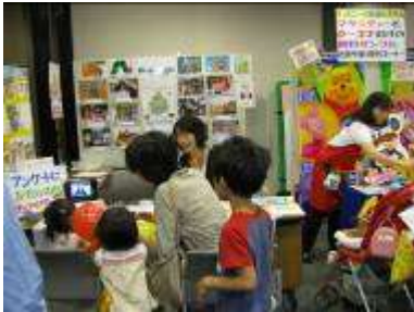
ラボ平内パーティー