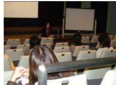
ハッピーライフ&キャリアの