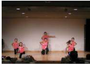
幼稚園児からのバトントワリング