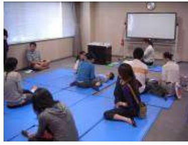
わらべうたあそび ♪ははこのじかん