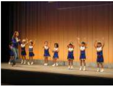
Cuteに応援・キッズチア