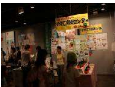
浦安市子育て応援センター