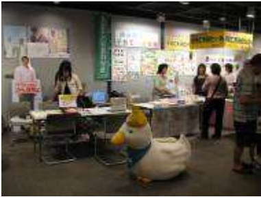
アメリカンファミリー生命保険会社