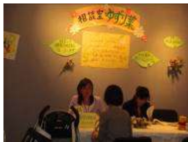
家族・子育て相談「ゆずり葉」