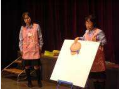
ヤクルトミニシアター