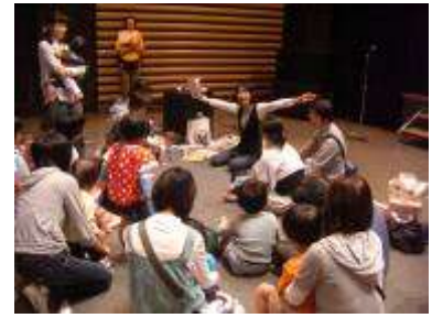
英語で絵本を楽しもう