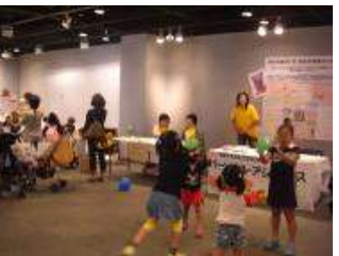
中核地域生活支援センターがじゅまるち