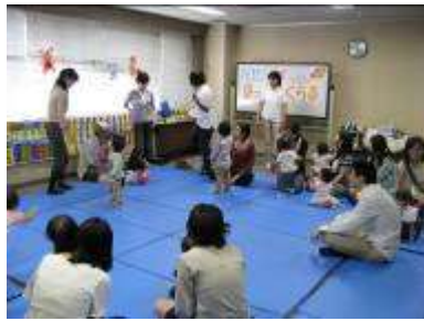
ほっぺんくらぶであそぼう