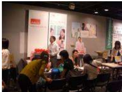
アデコ(株) 浦安支店