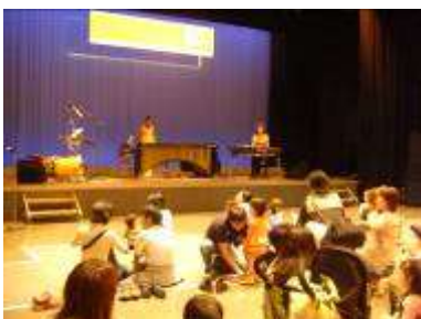
トリオ・デ・アミーゴの愉快的な音楽会