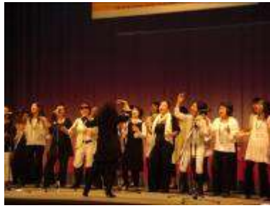
ママもシンガー！ゴスペルライブ