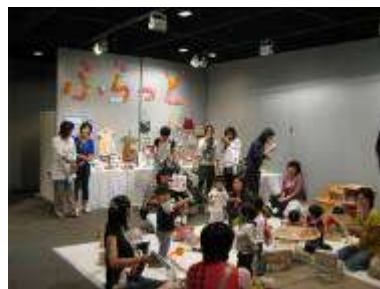
ベビー広場（子育てテラスふらっと）