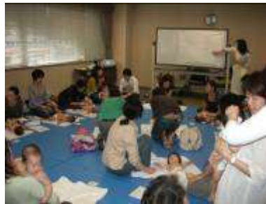
ベビーマッサージ体験