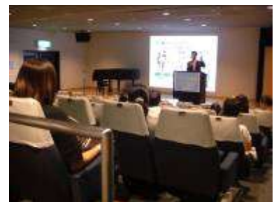
スイミングと健康